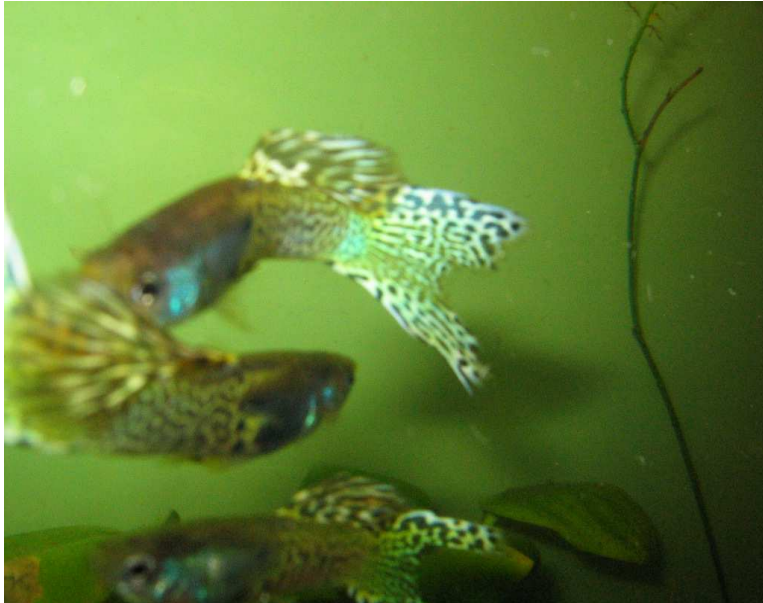
Ett par av F1 generationens hanar

Om vi inte lyckas åstadkomma bilderna i färg vid kopiering får vi försöka om det går att ta in bilderna på hemsidan, alternativt kan jag sända dokumentet med bilder via internet till den som så önskar.