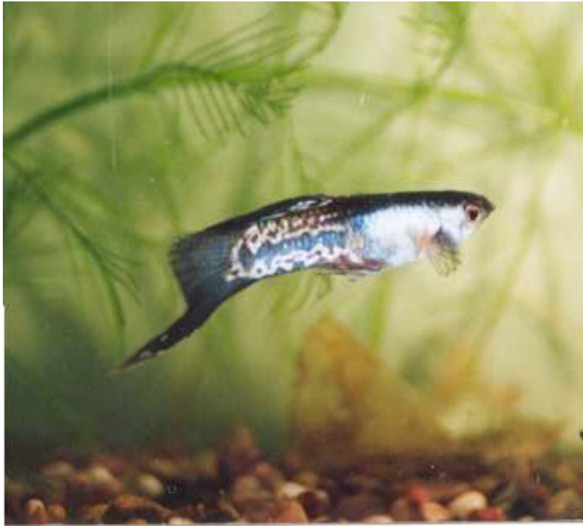
Undersvärd pink hane med mönster.

Förutom korsningen med filigrantecknade honor och de rundstjärthanar som hade moskvablå framkropp, filigranteckning och den mörkare avslutningen på stjärtfenan släppte jag innan dess ihop samma fem hanar med några honor av typen ej pink. Dessa har nu sedan de blivit könsmogna börjat föda yngel, som överlever tack vare grönt plasttrassel i akvariet. Ännu så länge är de för små för att man skall kunna se någon färgteckning.